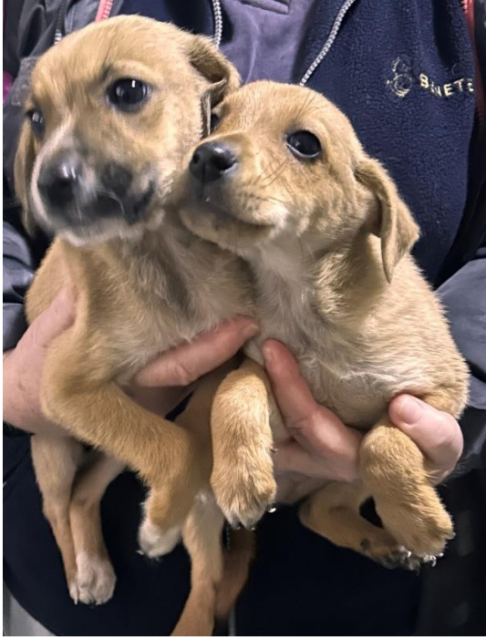
Tom and Jerry